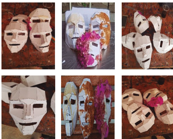
Figura 3. Registros secuenciados en sesión: El objeto que construyo me construye.

Al sumergirse en el proceso de investigación doctoral, es una suerte de atrapamiento corporal en fricción, su dinámica es la de marcar y ser marcado por lo que toca/observa/huele/escucha/saborea, ya sea objetos, otros cuerpos, otros sistemas significantes. En esa relación con la materialidad el cuerpo se reconoce como ma-