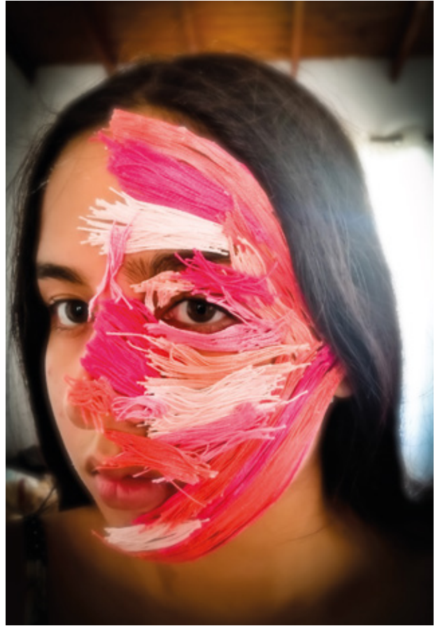
Figura 2. Diálogo número uno