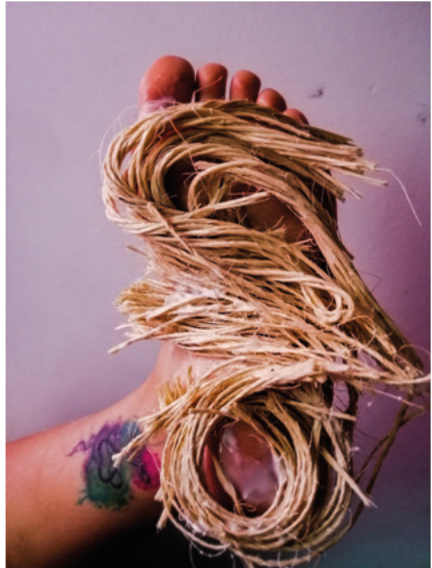
Figura 5. Diálogo número cuatro

Duración de la experimentación: 1 hora 50 minutos