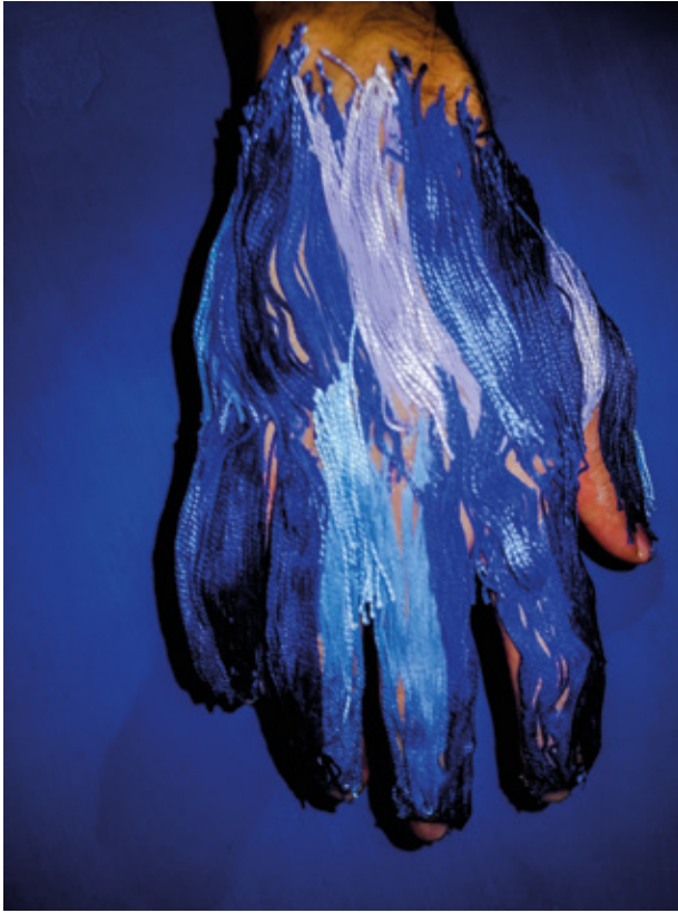
Figura 6. Diálogo número cinco