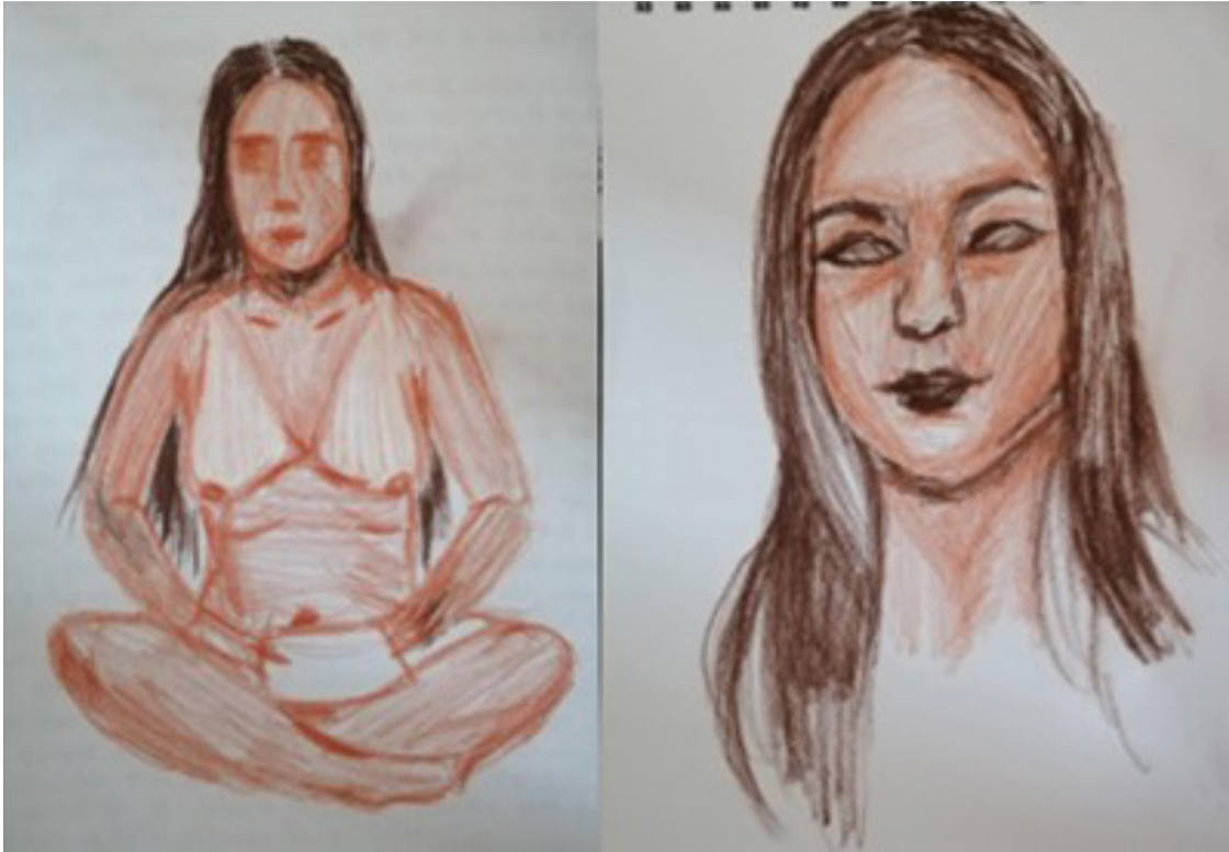
Figura 1. Registro sin lentes