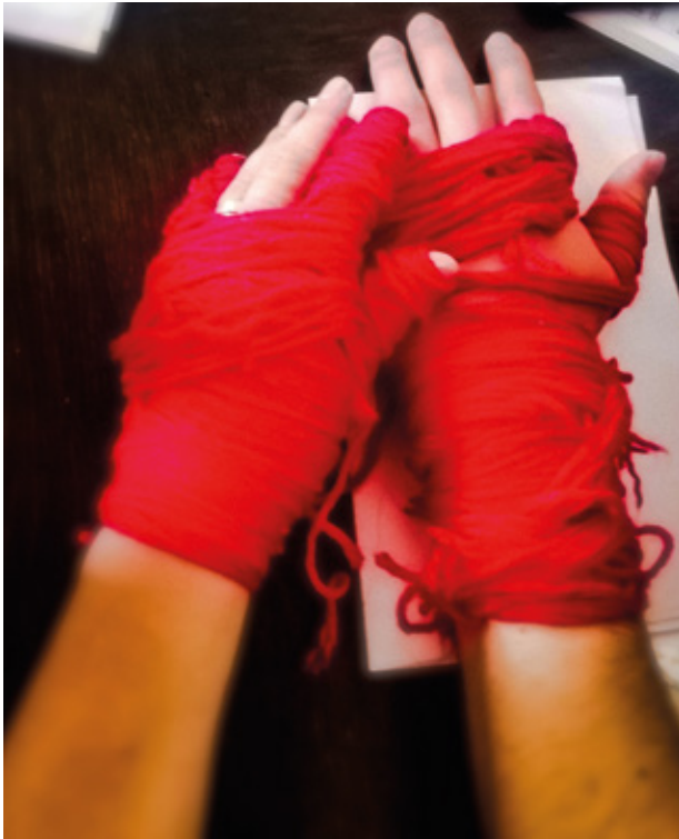
Figura 4. Diálogo número tres